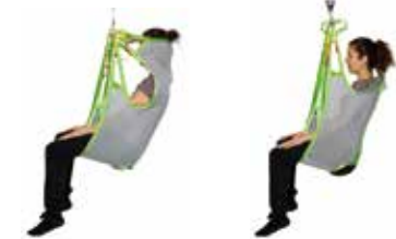
ハイバックメッシュタイプ