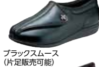
ブラックスムース (片足販売可能)