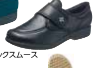
ブラックスムース