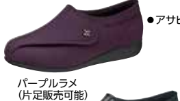
パープルラメ (片足販売可能)