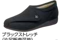
ブラックストレッチ (片足販売可能)