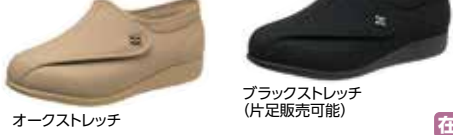
オークストレッチ