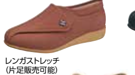
レンガストレッチ (片足販売可能)