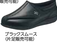
ブラックスムース (片足販売可能)