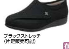
ブラックストレッチ (片足販売可能)