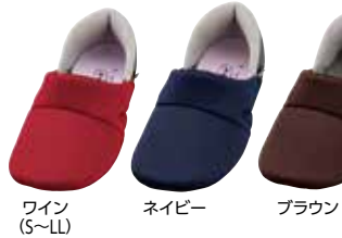
ワイン (S~LL) ネイビー ブラウン

201479 4,400円 片足2,200円 税抜4,000円 税抜2,000円