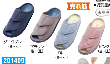
ダークグレー (M~3L) ブラウン (M~3L) ブルー (M~3L) ピンク (M~LL)

201409 3,960円 片足1,980円 税抜3,600円 税抜1,800円