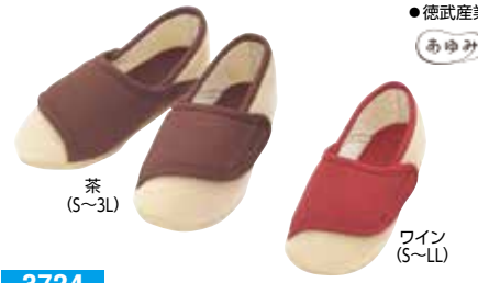
茶 (S~3L) ワイン (S~LL)