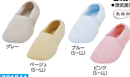
グレー ベージュ (S~LL) ピンク (S~LL)

201044 3,520円 片足1,760円 税抜3,200円 税抜1,600円