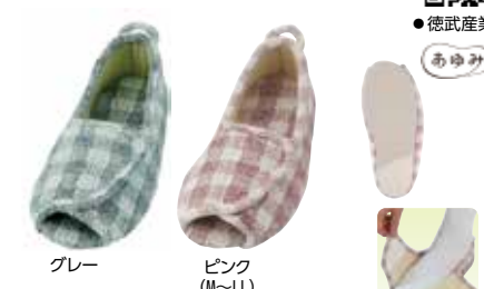
グレー ピンク (M~LL)

201125 4,400円 片足2,200円 税抜4,000円 税抜2,000円