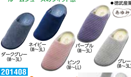
ダークグレー (M~3L) ネイビー (M~3L) パープル (M~3L) ピンク (M~LL) グレー (M~3L)

201408 3,960円 片足1,980円 税抜3,600円 税抜1,800円