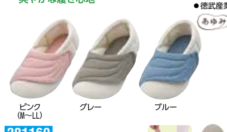
ピンク (M~LL) グレー ブルー

201169 4,400円 片足2,200円 税抜4,000円 税抜2,000円