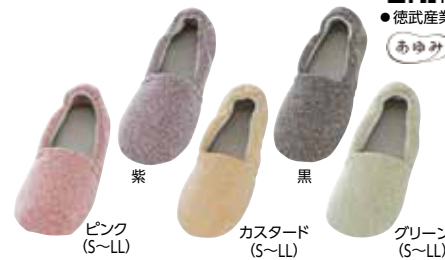
ピンク (S~LL) 紫 カスタード (S~LL) グリーン (S~LL)

201346 3,520円 片足1,760円 税抜3,200円 税抜1,600円