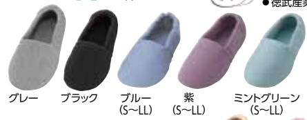
グレー ブラック ブルー (S~LL) 紫 (S~LL) ミントグリーン (S~LL)

品名 エスパド エスパドワイド 両足(税抜) 3,520円 (3,200円) 3,960円 (3,600円) 片足(税抜) 1,760円 (1,600円) 1,980円 (1,800円) ベージュ (S~LL) ピンク (S~LL)