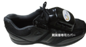
靴装着専用カバー